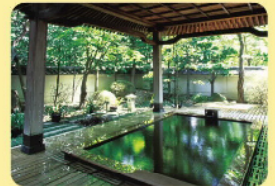
上諏訪温泉・下諏訪温泉 (諏訪市・下諏訪町)