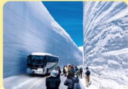
雪の大谷(富山県)〈4月~6月〉