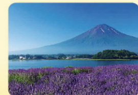
富士山(山梨県・静岡県)